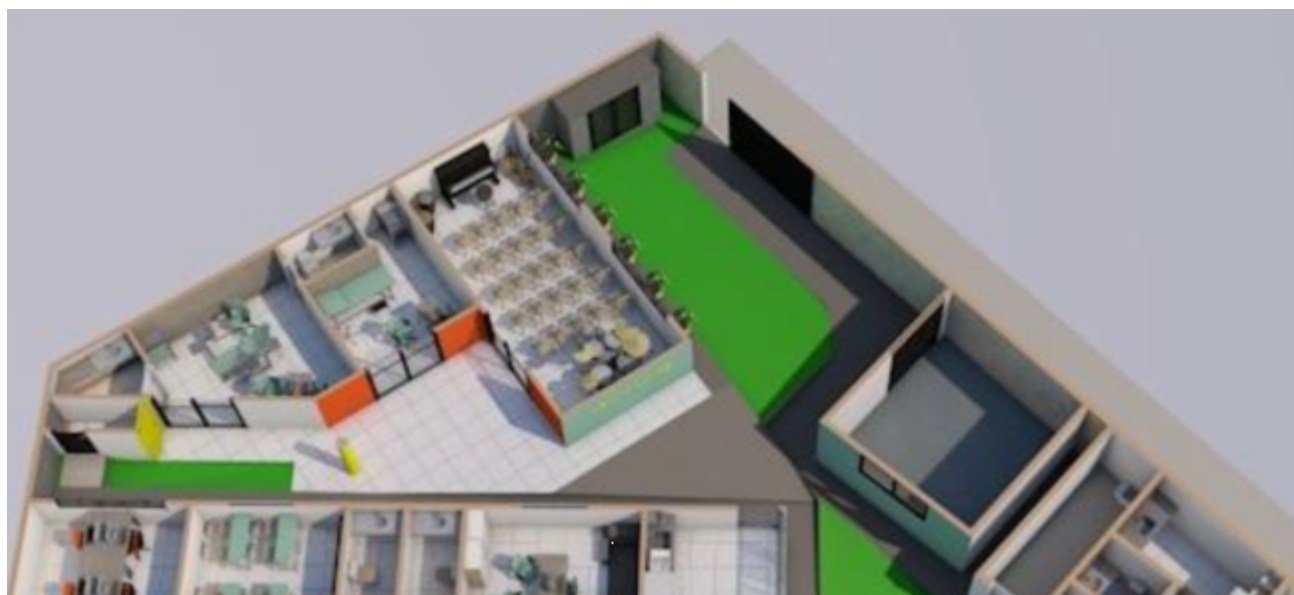
Figura 04 – Vista superior das edificações em perspectiva