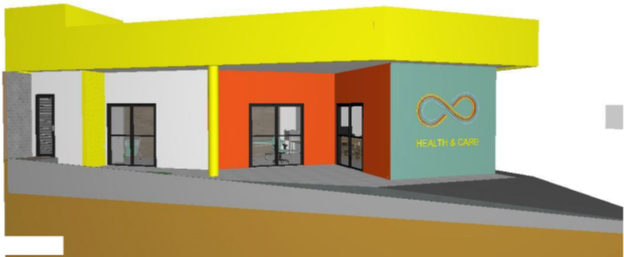
Figura 02 – Perspectiva da edificação do anexo médico e cultural