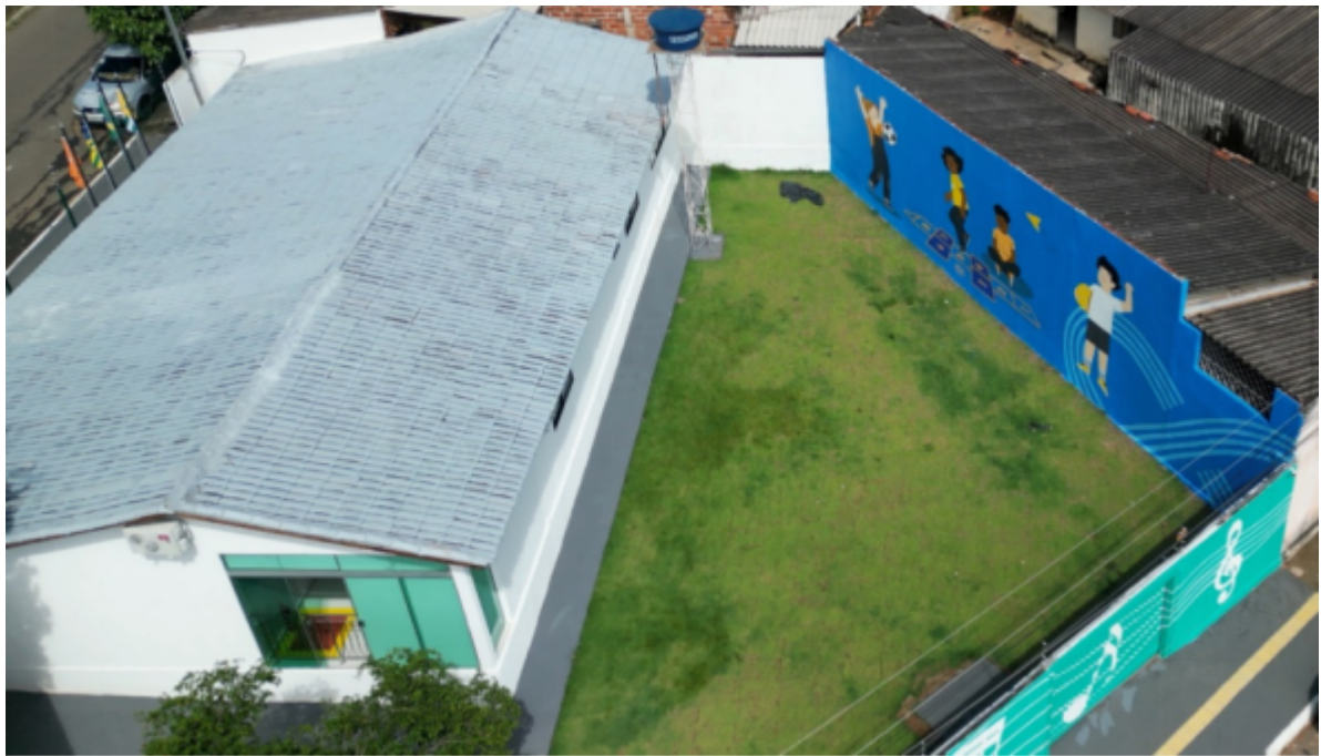
Figura 01 – Foto aérea do espaço onde será construído o anexo médico e cultural